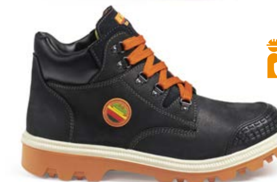
21621 300 DEFEND H S3 WR SRC Nero · Black · Schwarz