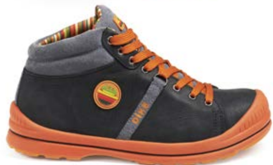
27022 300 SUBLIME H S3 SRC Nero · Black · Schwarz