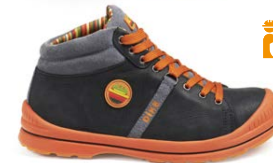
27622 300 SUBLIME H S3 WR SRC Nero · Black · Schwarz